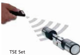
TSE Set 5003 E-KEY

Komplett-Set für Innen- und Außentüren: Elektronischer TSE-Profil-Zylinder mit Funkverbindung zum Funkschlüssel E-KEY, inkl. Batterien, Bedienungs- und Einbauanleitung