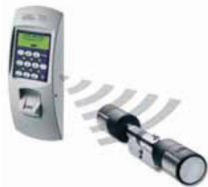
TSE Set 5002 FINGERSCAN

Komplett-Set für Innen- und Außentüren: Elektronischer TSE-Profil-Zylinder mit Funkverbindung zum KEYPAD FINGERSCAN, inkl. Batterien, Bedienungs- und Einbauanleitung