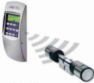
TSE Set 5001 PINCODE

Komplett-Set für Innen- und Außentüren: Elektronischer TSE-Profil-Zylinder mit Funkverbindung zum KEYPAD PINCODE, inkl. Batterien, Bedienungs- und Einbauanleitung