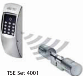
TSE Set 4001 PINCODE

Komplett-Set für Innen- und Außentüren: Elektronischer TSE-Profil-Zylinder mit Funkverbindung zur Codetastatur, inkl. Batterien, Bedienungs- und Einbauanleitung