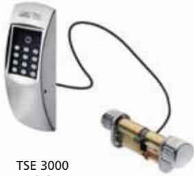
TSE 3000 BASIC

Komplett-Set für Innen- und Außentüren: Elektronischer TSE-Profil-Zylinder über Kabel mit Codetastatur verbunden, inkl. Batterien, Bedienungs- und Einbauanleitung