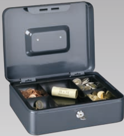
Abb.: CB 20